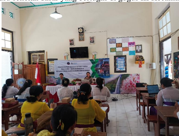
Gambar 1. Pemberian Materi Terkait Artikel Ilmiah

Kegiatan pembukaan Pengabdian kepada Masyarakat ini dibuka oleh ketua tim pengabdian, yang ditemani juga oleh ibu ketua gugus III Kecamatan Buleleng, narasumber pelatihan, dan anggota pengabdian. Peserta yang hadir pada kegiatan ini sebanyak 20 orang guru sekolah dasar yang bertugas di gugus III Kecamatan Buleleng.