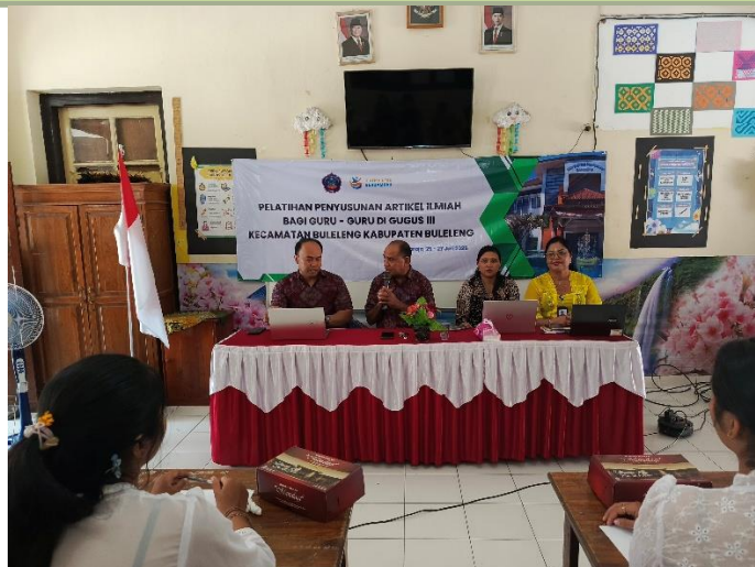
Gambar 1. Pembukaan Kegiatan Pengabdian kepada Masyarakat

Kegiatan pembukaan Pengabdian kepada Masyarakat ini dibuka oleh ketua tim pengabdian, yang ditemani juga oleh ibu ketua gugus III Kecamatan Buleleng, narasumber pelatihan, dan anggota pengabdian. Peserta yang hadir pada kegiatan ini sebanyak 20 orang guru sekolah dasar yang bertugas di gugus III Kecamatan Buleleng.