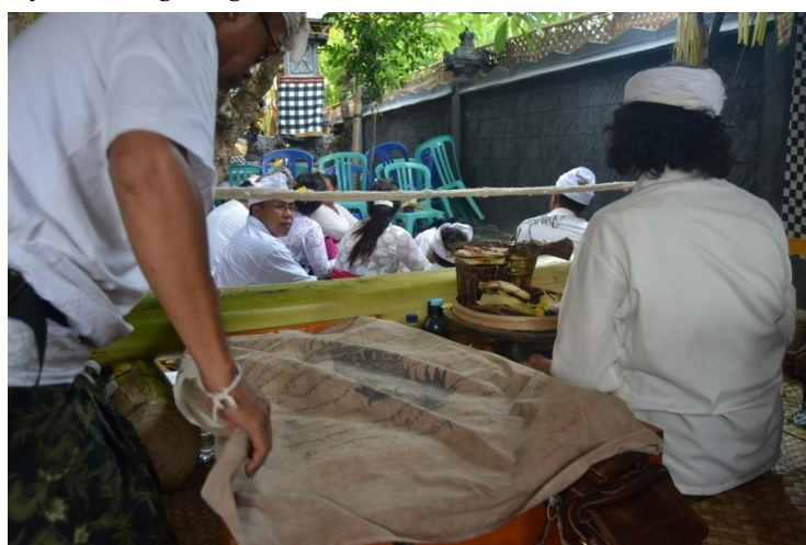
Gambar 3. Mengambil Wayang dari Kotak

Prosesi inti merupakan prosesi yang paling utama dalam suatu pementasan wayang lemah . Dalam prosesi inti inilah banyak terdapat nilai-nilai yang mengandung makna filosofis disampaikan. Prosesi inti inilah yang nantinya dapat dijadikan patokan bagi semeton yang melaksanakan upacara yadnya dalam hal ini semeton merajan pratisentana dalem tarukan dalam upacara dewa yadnya atau ngenteg .