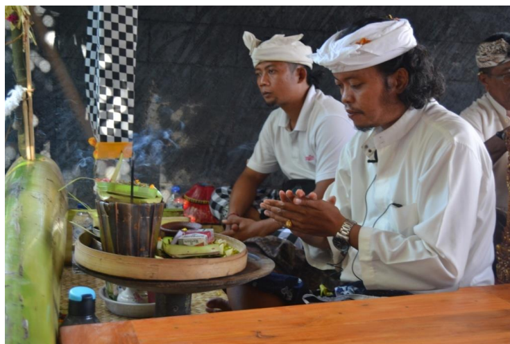
Gambar 2. Dalang Menghaturkan Daksina Pengungkap

Komponen dalam daksina pengungkap tersebut diatas tidak bisa dipisahkan dalam pementasan wayang lemah karena jika salah satunya saja tidak ada maka dianggap pementasan wayang lemah tidak tuntas.