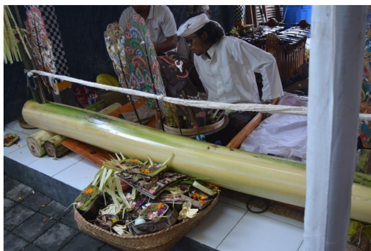
Gambar 4. Dalang Menghaturkan Banten Penglukatan Wayang

Setelah selesai pementasan wayang lemah sang dalang melakukan prosesi akhir. Berdasarkan hasil observasi pada tanggal 3 Mei 2015, dapat dilihat pada prosesi akhir ini terdapat beberapa ritual dengan sarana upakara , upakara yang digunakan antara lain Banten Penglukatan Wayang yang terdiri dari Peras Pengambeian , Daksina Gede , Banten Suci , Sorohan , Pengulapan , Gelar Sanga , Pejati , Segehan Panca Warna , Pesucian , Toya Anyar , Sekar lima warna , Beras Kuning , banten diatas digunakan dalang untuk membuat tirtha .