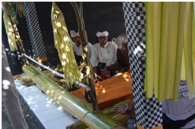
Gambar 1. Perlengkapan Pementasan Wayang Lemah

Setelah melewati beberapa proses atau tahapan sebelum melakukan pementasan terdapat prosesi awal yang harus dilakukan. Prosesi awal ini berfungsi untuk mempersiapkan perlengkapan dan juga persiapan diri untuk sang dalang. Pada tahap ini pada umumnya sang dalang memohon kelancaran dan juga membersihkan perlengkapan yang digunakan dalam pementasan.