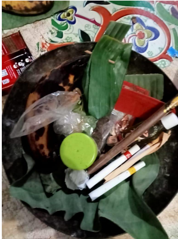
Gambar 3.2 Salah satu contoh sesajen yang terdapat dalam seni benjang helaran

“jadi hakikat sesajen disini bukan untuk musyrik, tetapi untuk dimakan bersama sama. Ayam bakakak nya dan makanan lainnya bisa dimakan oleh manusia, tidak diberikan kepada makhluk gaib. Buah buahan dalam sesajen itu untuk para pemain, tidak ada maknanya sama sekali. Dimana sesajen ini dimakannya setelah acara ini usai. Isi sesajen ini tidak dibuang, karena apabila dibuang akan menjadi mubadzir. Contoh ayam bakakak akan dibawa pulang oleh pemain dan digoreng untuk dimakan bersama keluarga. Yang biasa dimakan ditempat seperti minuman dan buahan, walaupun yang metah baru di bawa pulang untuk dimasak” (Wawancara bersama Bapak Asep Badjir, pemilik salah satu Paguyuban Benjang Heleran, personal communication, April 3, 2024)