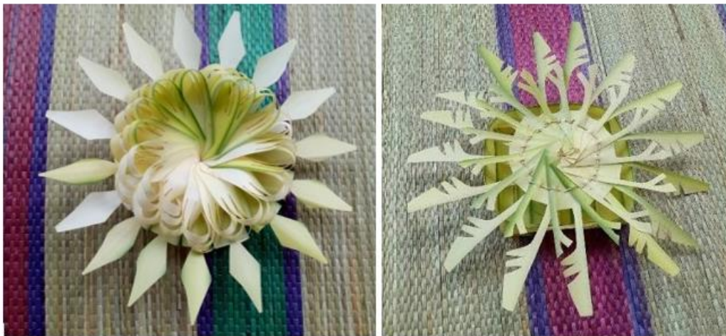
Gambar 3.2 Canang Sari dan Canang Ceper

Ketika ada tamu yang datang ke rumah, maka tuan rumah selalu menyuguhkan sirih. Begitu pula di Bali bahwasanya umat Hindu dalam upacara yajnya penggunaan sirih selalu kita lihat dalam setiap banten. Kekawin Nitisastra V.4 menyebutkan “tanpa sirih di bibir perasaan menjadi sepi ( masepi tang waktra tan amucang wang ). Kembali lagi pada pengertian canang bahwa sirih, meskipun sirih itu tidak begitu menonjol dalam banten canang namun menjadi unsur terpenting dalam banten canang yang dibentuk menjadi porosan, sebagai lambing Tri Murti. Canang merupakan sarana penghubung umat Hindu kepada Hyang Widhi Wasa, untuk memohon segala sesuatunya.