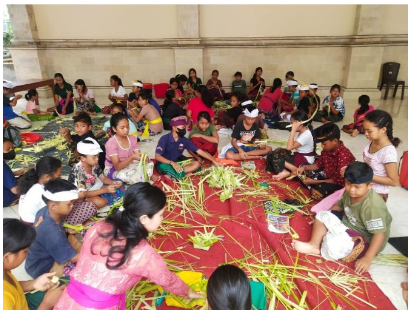
Gambar 3.1 Praktek Langsung

Pengabdian Masyarakat dilaksanakan di Desa Tembok, Kecamatan Tejakula, Kabupaten Buleleng, Bali. Peserta yang mengikuti pengabdian masyarakat adalah siswa Sekolah Dasar kelas 4-6 yang berasal dari desa setempat. Peserta yang mengikuti dalam pengabdian masyarakat terdiri dari laki-laki dan perempuan yang secara keseluruhan berjumlah 57 orang. Kegiatan pengabdian masyarakat diselenggarakan pada hari Minggu, 27 November 2022 bertempat di Wantilan Kantor Berbekel Desa Tembok.