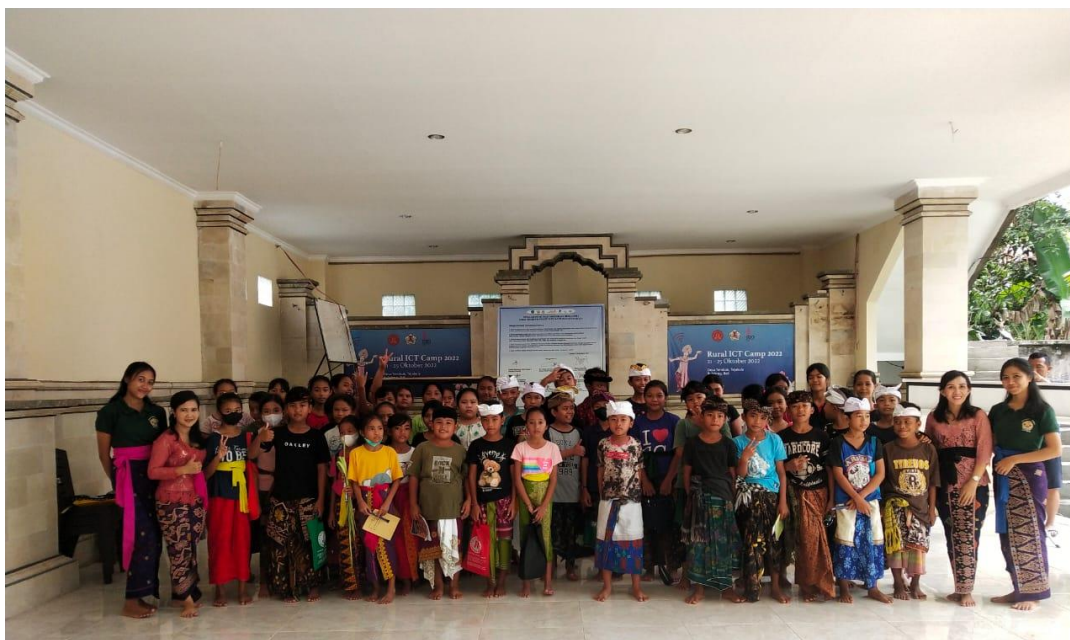
Gambar 3.4 Foto Bersama Peserta dan Narasumber

maka terciptanya bentuk ketupat yang berbeda-beda diantaranya sebagai gambaran manusia, para Dewata serta alam ( bhuana agung ). Salah satunya adalah tipat sari, proses pembuatannya sangat sederhana yaitu menggunakan 1 batang janur yang dibelah-belah tanpa lidi. Tipat sari ini biasanya ada pada banten Some Ribek yaitu dua hari setelah Hari Suci Saraswati. Cara membuatnya tidak terlalu rumit yaitu janur diletakkan saling mengkait satu sama lain, kemudian kaitan yang dibawah dilipat selanjutnya ditarik sehingga berbentuk segitiga mebuca (Tambang Raras,Niken, 2007:138).