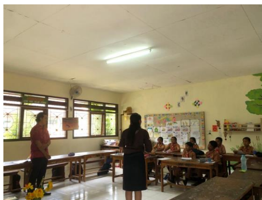
Gambar 3. Sharing Penanaman Karakter dari Guru kepada Peserta Didik