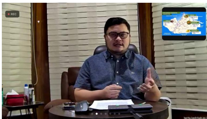
Gambar 4. Paparan tentang strategi Bupati Kediri