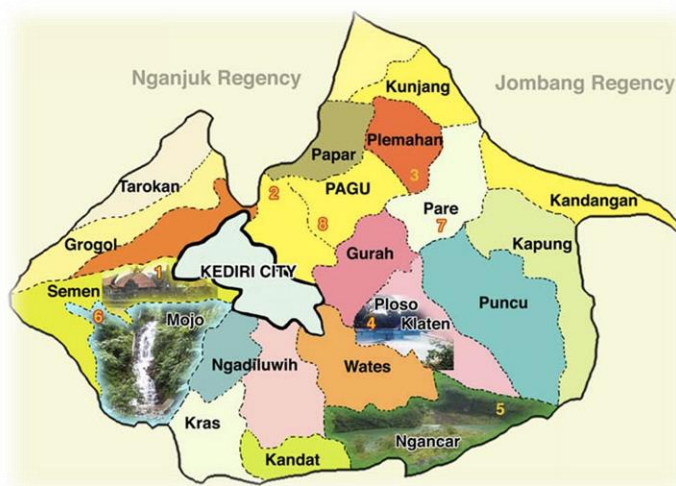
Gambar 1. Peta Kecamatan di Kabupaten Kediri

Kediri merupakan salah satu kabupaten di Provinsi Jawa Timur dengan jumlah penduduk mencapai 1,684 juta jiwa yang tersebar di 26 kecamatan. Adapun 26 kecamatan tersebut terdiri dari kecamatan Pare, Ngasem, Badas, Banyakan, Gampengrejo, Grogol, Gurah, Kandangan, Kandat, Kayen Kidul, Kepung, Kras, Kunjang, Mojo, Ngadiluwih, Ngancar, Pagu, Papar, Plemahan, Plosoklaten, Puncu, Purwoasri, Ringinrejo, Semen, Tarokan, dan Wates. Secara topografi, batas wilayah Kabupaten Kediri di wilayah barat adalah Gunung Wilis yang di lerengnya ada kecamatan Mojo, Semen, Banyakan, dan Tarokan, Batas Wilayah Timur adalah Gunung Kelud yang berbatasan dengan Kecamatan Puncu dan Ngancar, Batas Wilayah Selatan ada Kabupaten Blitar dan Tulungagung yang berbatasan dengan Kecamatan Kras dan Ringinrejo, dan Batas Wilayah Utara adalah Sungai Brantas dan Kabupaten Jombang yang berbatasan dengan Kecamatan Kunjang, Badas, dan Purwoasri.