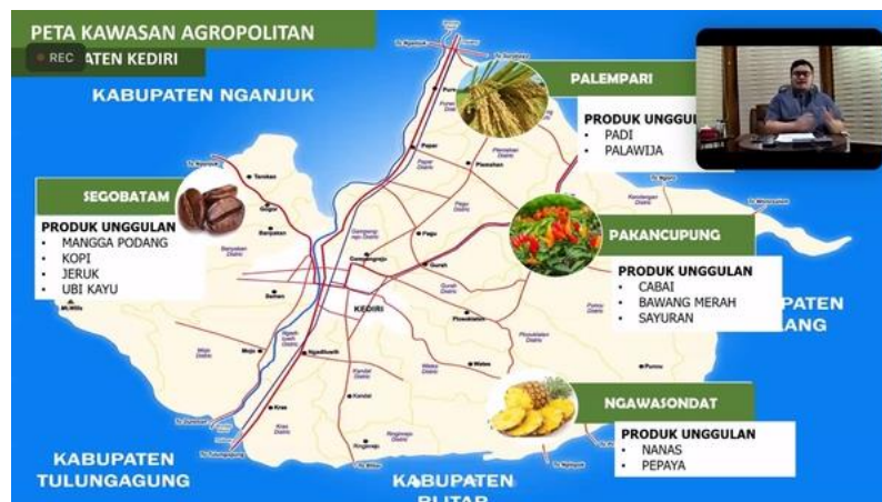
Gambar 3. Desain Kawasan Wilayah Agropolitan Kabupaten Kediri

Berdasarkan gambar 3 dijelaskan bahwa di wilayah kecamatan di Kabupaten Kediri terdapat beberapa pertanian, perkebunan, dan potensi alam yang dapat dijadikan sebagai produk unggulan untuk bisa dikembangkan secara optimal melalui desain kawasan wilayah. Adapun pembagiannya dapat dilakukan sebagai berikut.