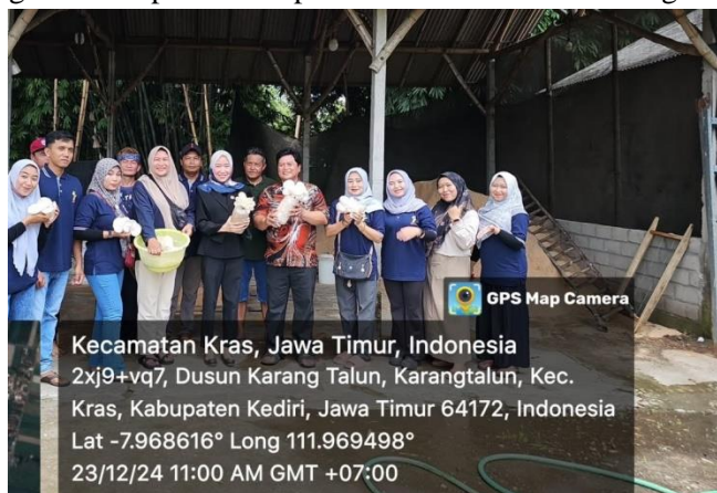
Gambar 5. Dampak Signifikan dari Budidaya Jamur Tiram