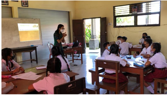
Gambar 1. Tahapan Pembelajaran Berdiferensiasi Konten di Kelas