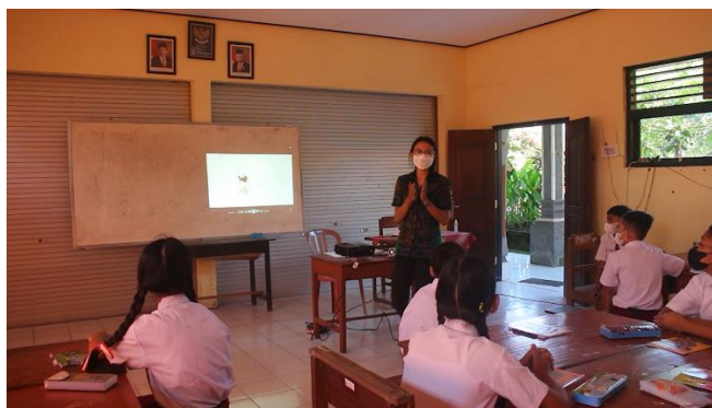
Gambar 4. Suasana Lingkungan Belajar Siswa

Pembelajaran berdiferensiasi pada dasarnya menyatukan unsur-unsur pembelajaran berdiferensiasi dan keragaman siswa. Artinya setiap unsur pembelajaran (isi, proses, produk, dan lingkungan belajar) dapat dibedakan berdasarkan kesiapan belajar, minat, dan profil belajar siswa yang berbeda satu sama lain. Pemenuhan belajar siswa merupakan salah satu dasar dari proses belajar dalam fitrah siswa. Lebih jauh, diferensiasi dapat membantu Profil Pelajar Pancasila dalam mengembangkan profil keimanan, kemandirian, gotong royong, keragaman global, nalar kritis dan kreatif. Sehingga pembelajaran berdiferensiasi untuk merdeka belajar murid di kelas.