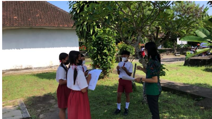
Gambar 2. Tahapan Pembelajaran Berdiferensiasi Proses

Diferensiasi process merupakan kegiatan-kegiatan yang bermakna dalam proses pembelajaran di dalam kelas. Kegiatan pembelajaran dapat dilakukan secara individu ataupun kelompok.