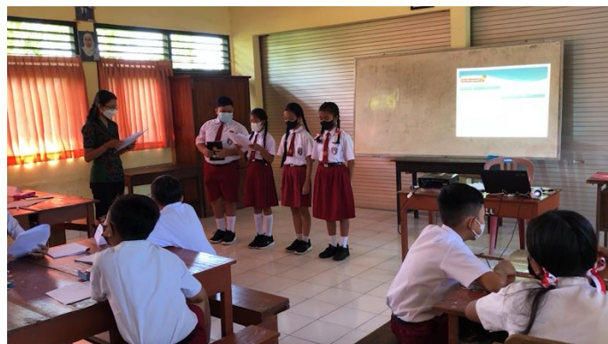
Gambar 3. Tahapan Pembelajaran Berdiferensiasi Produk