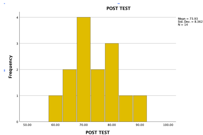
Gambar 2. Hoistogram Data Deskriptif Posttest

Hasil uji statistik diatas menggambarkan, data pre-test memiliki sig sebesar 0.53 ( > 0.05 ), sedangkan data post-test memiliki tingkat signifikansi sebesar 0.200 ( > 0.05 ). Karena tingkat signifikansi data pre test dan post test lebih besar dari batas yang telah ditetapkan, yaitu 0.05, dapat dikatakan bahwa data berdistribusi normal. Hasil dari uji homogenitas menggunakan homogeneity of variance menunjukkan hasil signifikansi lebih dari 0,05 yang dimana menunjukkan data berdistribusi dengan normal.