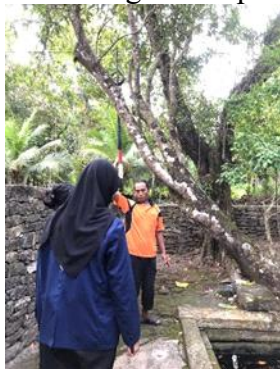
Gambar 1. Lokasi pengambilan air suci

menandakan hubungan harmonis antara manusia, alam, dan Sang Pencipta, serta menjadi sarana spiritual dalam menjaga keseimbangan hidup.